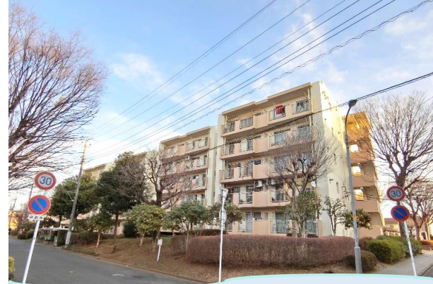
テレワークにもうれしい3LDKリノベーション!