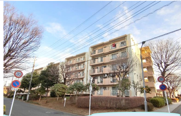
テレワークにもうれしい3LDKリノベーション!