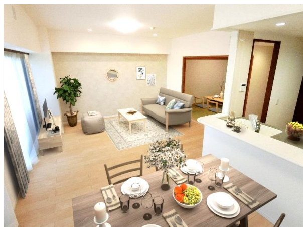
※ 実際のお部屋に、CG加工による家具等を配置した、イメージ画像です。