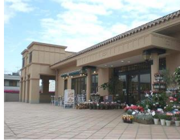
東急スクエアガーデンサイト