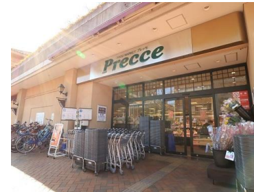
プレッセ田園調布店